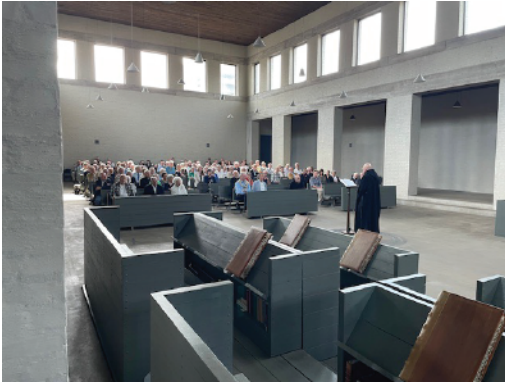
Een volle abdijkerk op 6 september 2025